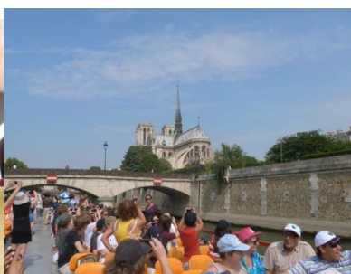
Vue du Bateau mouche