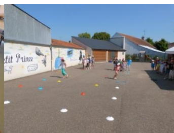
« Joue dans l'espace »