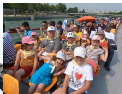
Sur le Bateau mouche