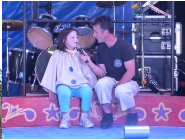
Sur la Piste du « Cirque Star »