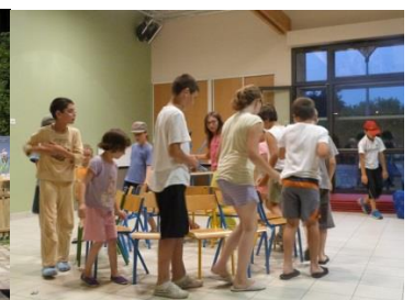
« La Fureur »