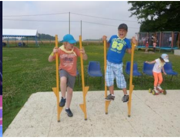
Plaine des jeux du « Cirque Star »