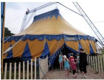
Chapiteau du « Cirque Star »

Le matin les enfants ont profité de la plaine des jeux, puis les artistes du cirque nous ont conviés à venir dans le chapiteau pour qu'ils nous expliquent de façon très ludique, ce qu'est un cirque, quels sont les divers corps de métiers et le matériel s'y trouvant. Puis ils nous ont fait une initiation au jonglage, au rouleau américain et comment faire le clown. L'après-midi les enfants sont retournés à la plaine des jeux, puis le chapiteau a ouvert ses portes pour nous faire leur show. Un super spectacle mêlant humour, émotion, jonglerie et clownerie. Très bon spectacle fait par une superbe équipe.