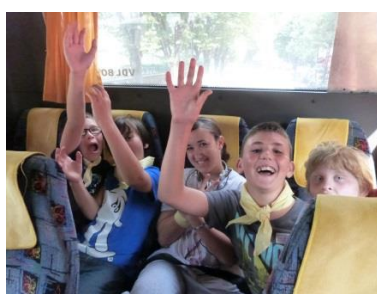
Dans le bus

Le midi nous avons mangé et joué au pied de la Tour Eiffel et fait une petit tour afin que les enfants voient bien l'architecture de celle-ci.