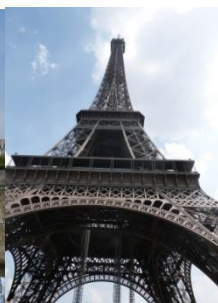
Au pied de la Tour Eiffel