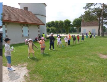
« Lancer de comètes »