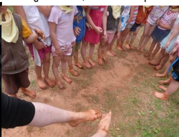
Parcours pied nu