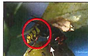
Extrémité des pattes de couleur brune