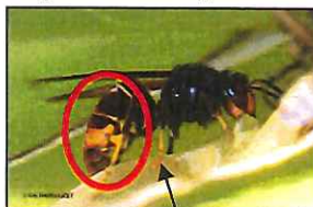
Extrémité des pattes de couleur jaune